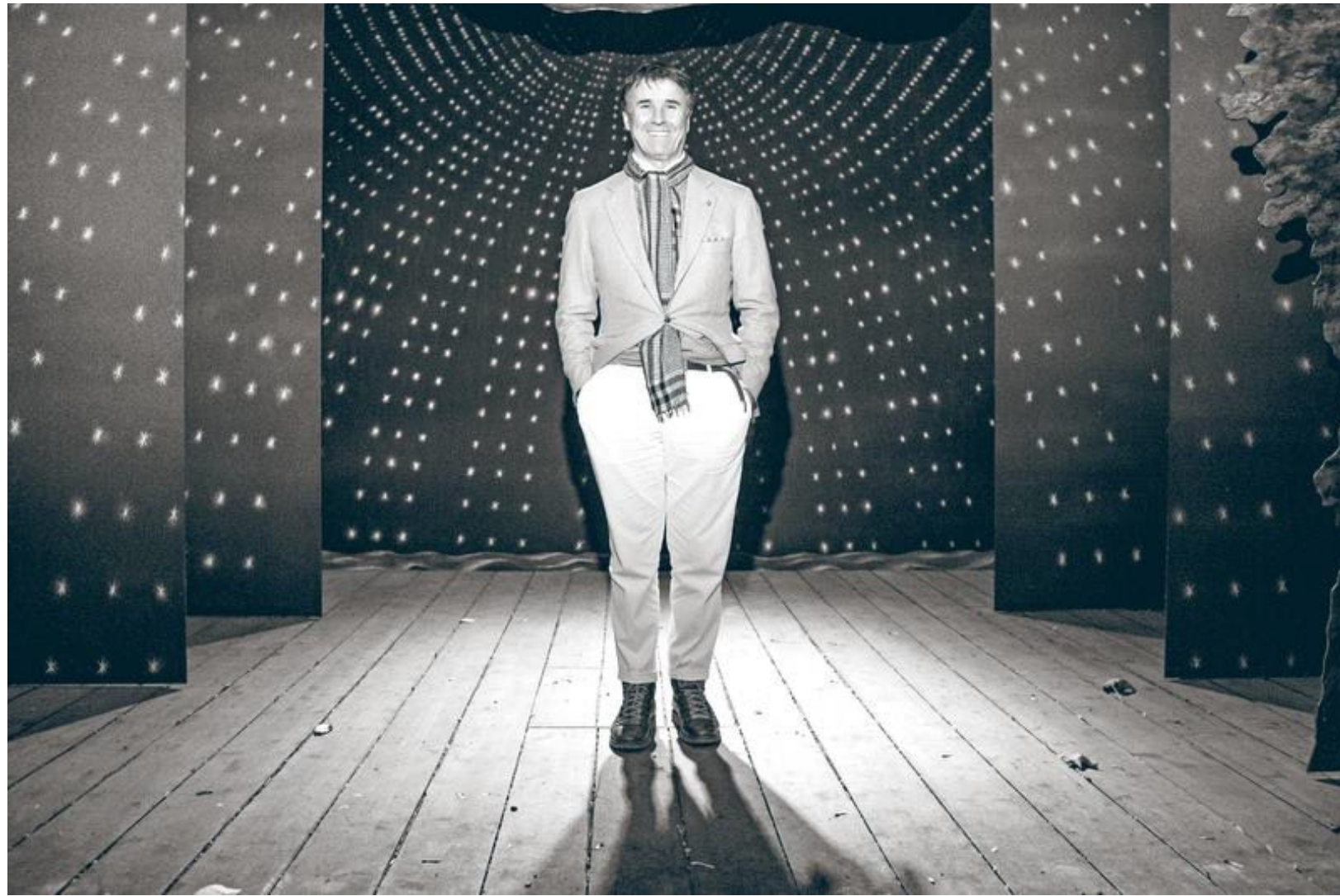
Ein Mann der Bühne: Brunello Cucinelli im Bühnenbild von Karl-Ernst Herrmann zu „Wienerlieder“ im Berliner Ensemble

Unter den Jungen ja. Seit 20 Jahren arbeite ich darauf hin, dass sich keiner schämt, Schneider zu sein. Deswegen unterhalten wir eigene Berufsschulen. Ich zahle dafür, dass die Leute da lernen, ohne Verpflichtung, nachher in Solomeo zu bleiben. Am Ende bekommen sie ein Zertifikat, damit können sie auch zu Giorgio Armani gehen und sagen, sie hätten ein Jahr bei Brunello verbracht. Schneider, Maurer, Gärtner werden be-