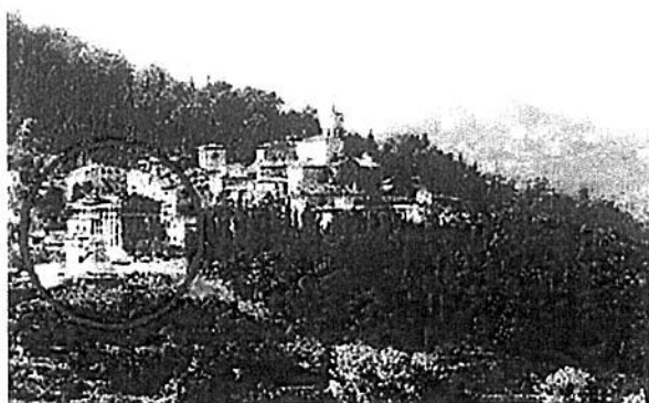
Una veduta di Solomeo dove il 3 settembre nasce il Teatro Cucinelli